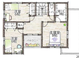
WIC=ウォークインクローゼット